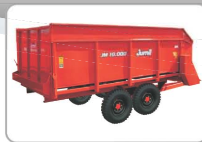
VAGÃO FORRAGEIRO JM10000: Opção de Vendas - sem dosador com rodagem simples (4 rodas) ou com rodagem tandem (4 rodas).