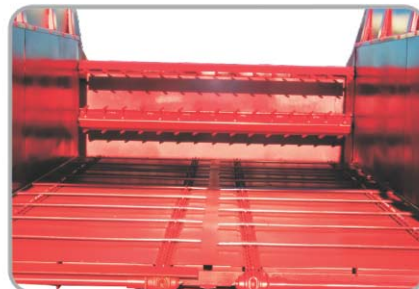
Agitadores: Permite a descompactação do volumoso.