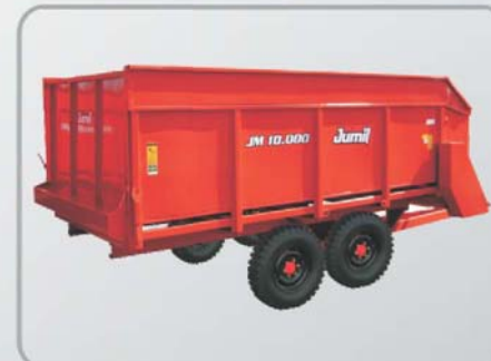
VAGÃO FORRAGEIRO JM10000 Rodagem Tandem