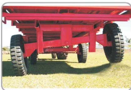
Rodagem Simples (JM6000/10000): Eixo traseiro equipado com balança que permite acompanhar as irregularidades do solo.