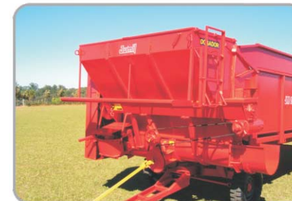
Dosador para concentrados