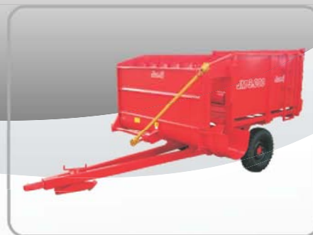
VAGÃO FORRAGEIRO JM3000