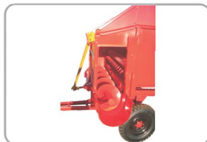
Rosca Sem-Fim: Sistema de descarga lateral esquerda efetuado por rosca sem-fim.