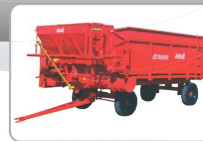
VAGÃO JM10000 COM DOSADOR: Opção de Venda - com dosador e rodagem simples (4 rodas)