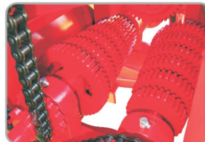
Câmbio de Regulagem do Dosador