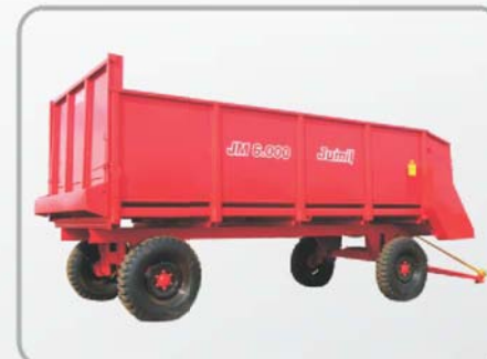
VAGÃO FORRAGEIRO JM6000 Rodagem Simples