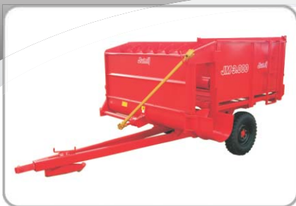
VAGÃO FORRAGEIRO JM3000: Opção de venda - sem dosador, Rodagem Simples - duas rodas.