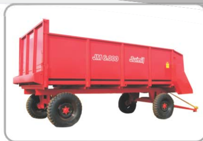
VAGÃO FORRAGEIRO JM6000: Opções de Vendas - sem dosador com rodagem simples (4 rodas) ou com rodagem tandem (4 rodas). Opcionalmente pode ser fornecido com dosador com rodagem simples (4 rodas).