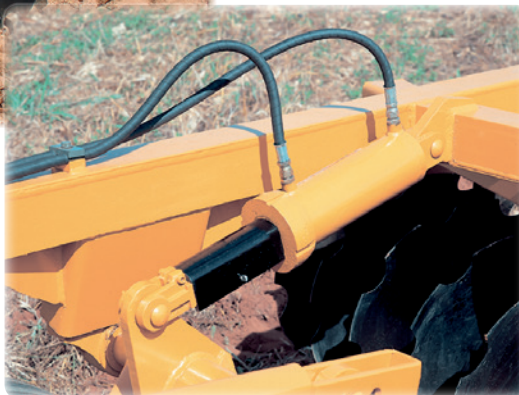
Trava do Cilindro para transporte

A estrutura de grande resistência, projetada para trabalhos árduos, mantém a estabilidade ideal; com penetração uniforme em qualquer tipo de solo.