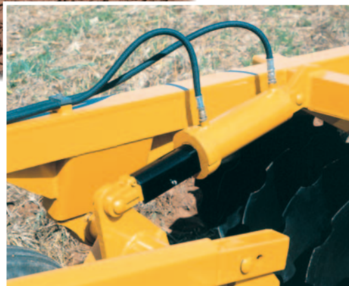
Trava do cilindro para transporte.

O sistema de rodagem, com comando hidráulico, agiliza as operações e permite o controle ideal da profundidade de corte. O transporte é feito rapidamente para qualquer local.