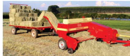
Braço alimentador com regulagem para fardos uniformes

A Express 5040 da Nogueira apresenta várias inovações que além do alto rendimento, a máquina dispõe de dispositivos de segurança operacional no "pick-up", no suporte de agulhas e também no volante que aciona o sistema central de engrenagens da máquina.